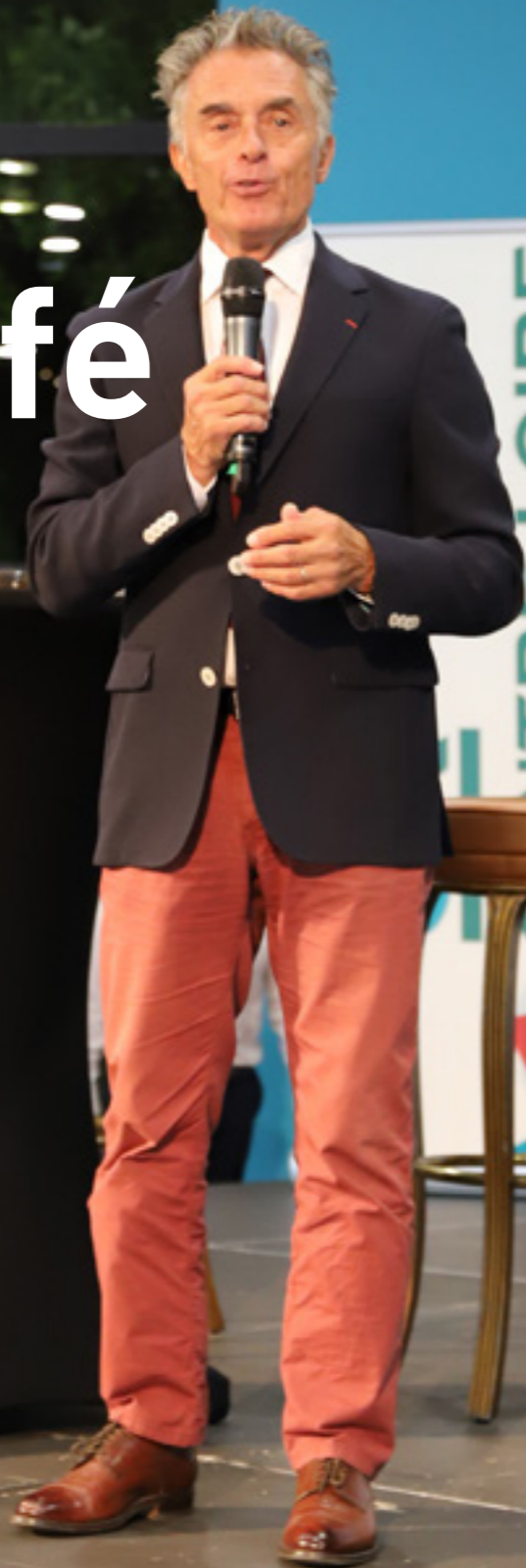
GÉRARD HOLTZ PARRAIN DES MASTERS SENIORS